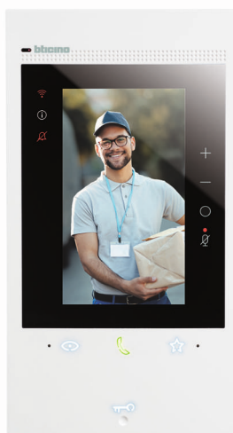
Classe 300EOS Soitonsiirrolla, 5" pystynäytöllä ja sisäänrakennetulla Alexalla. Bticino 344642.