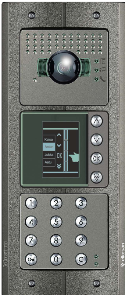
ACE00175 Selausvalinnalla, 1-n. 4000 kutsua

Lisää verkkosivuillemme! Kuvagalleria: https://elkesan.fi/kuvagalleria/