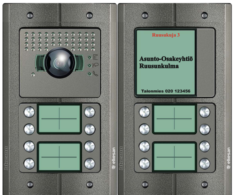
Bticino Sfera Robur, värrikamera ja 16 painiketta. Kuva-ala 2.4m x 1.2 m.