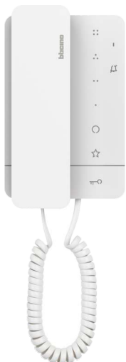
Classe 100 luurilla: Puhe, kutsu, ovenavaus. Soittoäänien poiskytkentä mykistykseen merkkivalolla