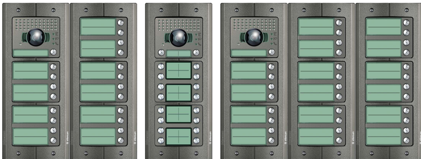
ACE00111 21 kutsua

Autamme mielellämme teille sopivan vaihtoehdon valitsemisessa. Alla yleisimpiä painiketaulukokoja. Huomattavaa on, että kutsutauluja voidaan asentaa niin vierekkäin kuin päällekkäin.