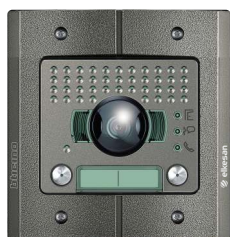
ACE00120 2 kutsua