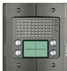
ACE00154 4 kutsua