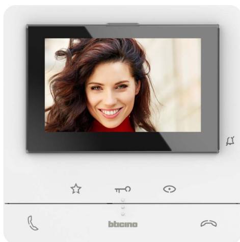
Classe 100 (344652) Luuriton vastauskoje: Puhe, kutsu, ovenavaus, soittoäänien säätö. Soittoäänien poiskytkentä mykistykseen merkkivalolla. 5" värinäyttö.

Kutsutaulut ovat erittäin ilkeivallankestäviä, sekä soveltuvat Suomen olosuhteisiin.